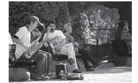
トルコにてストリートライブ

騒音で近所迷惑にならない場所探しのために、不動産屋さん巡りや、色々な方と交流できそうな場所に出かけ、情報を集めていく予定です。