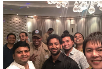
インド系の同僚とのパーティにて