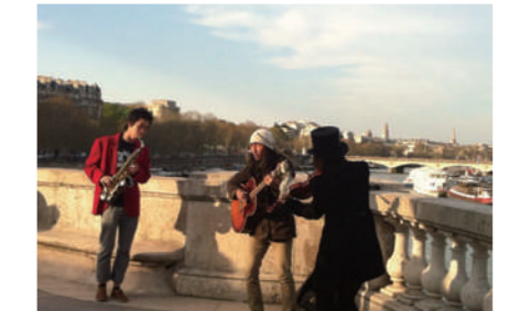
エッフェル塔の前で演奏