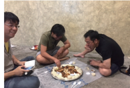
サウジのごはん。現地の習慣に倣って右手で食べます