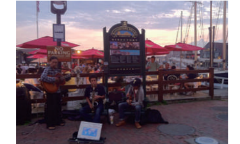
アメリカのニューポート