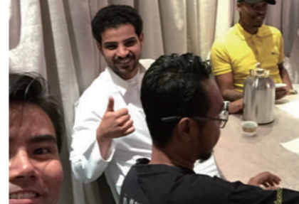
アラブ、アフリカ、アジア系様々な国の同僚との一枚