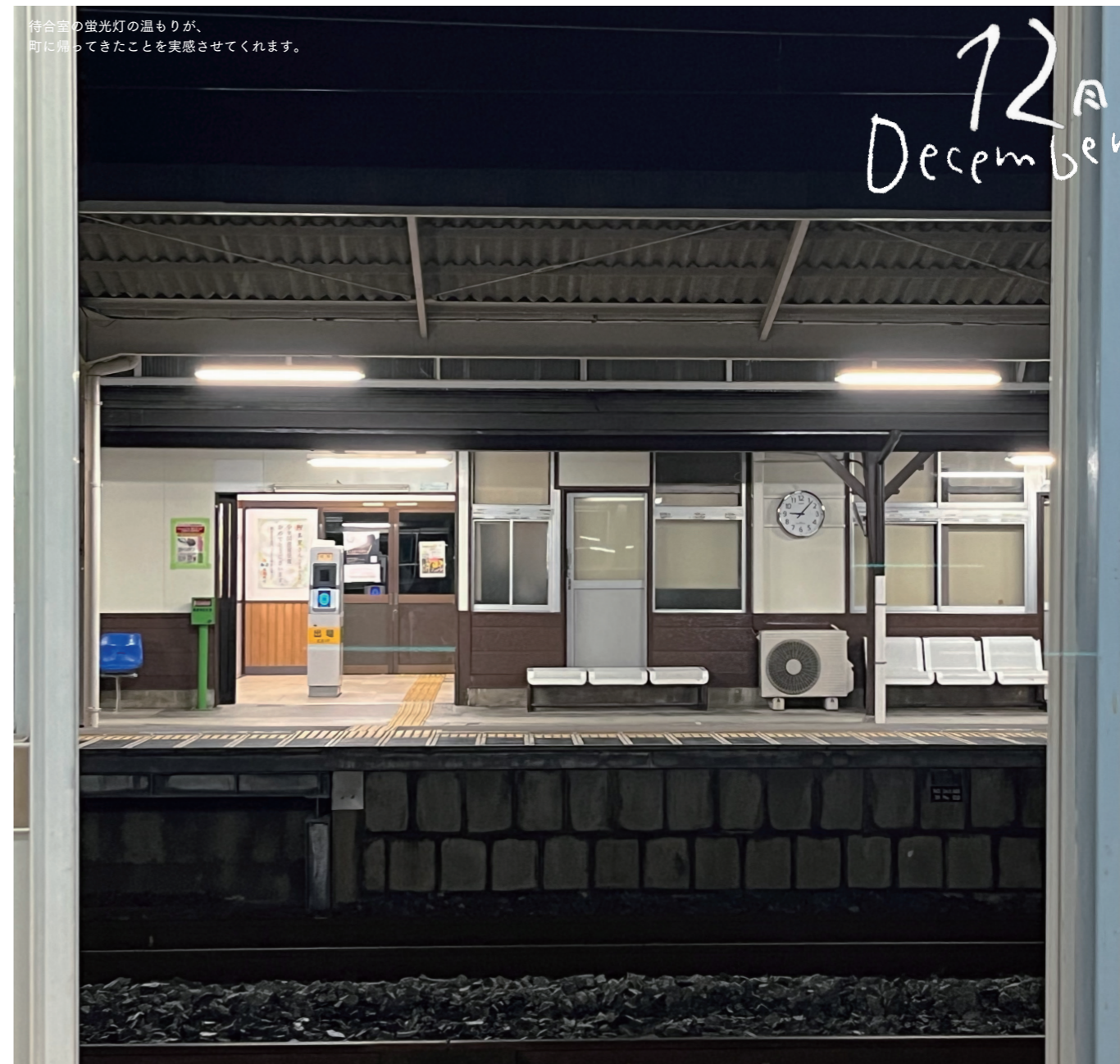
待合室の蛍光灯の温もりが、町に帰ってきたことを実感させてくれます。