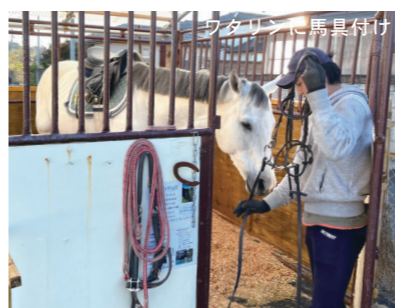
ワタリンに馬具付け