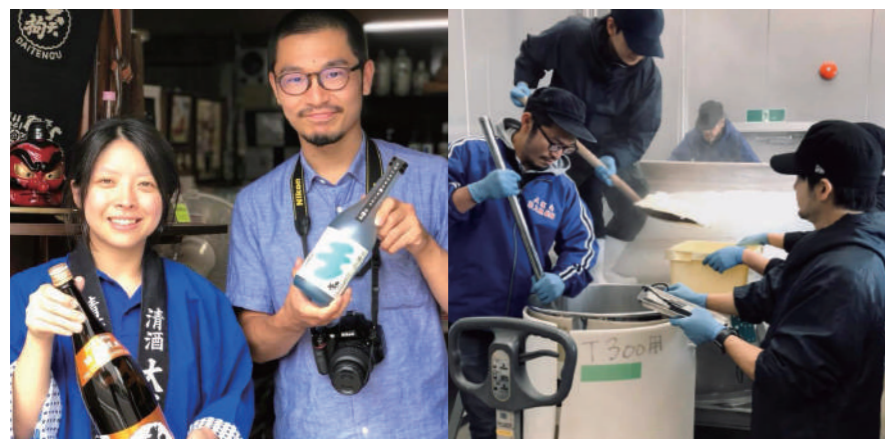
本宮市の大天狗酒造にて

1993年東京生まれ。大学在学中に日本酒の魅力の虜になり、2年生の時、復興支援イベントとして「食と酒 東北祭り」を立ち上げる。大学卒業後、研究開発系ベンチャー企業で働く。その後は、地酒専門店にて日本酒の知識を深め、酒造店にて住み込み酒造り修行を行う。2018年からは、フリーライターとして全国1500の酒蔵を巡る旅に出る(現在627蔵)。好きな物：お酒、旅、野球、発酵食品 座右の銘：和醸良酒 ①和をもって、良酒を醸す ②良酒をもって、和を醸す